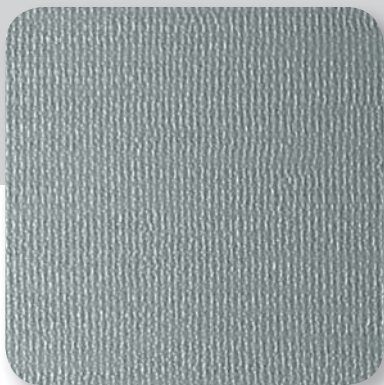
silbergrau silver grey