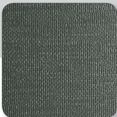
umbragrau umbra grey