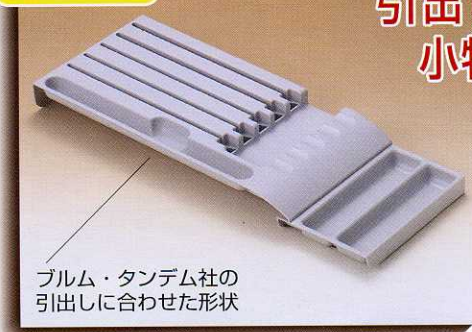
ブルム・タンデム社の引出しに合わせた形状