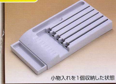
小物入れを1個収納した状態