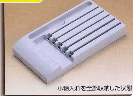
小物入れを全部収納した状態