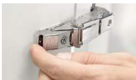
CLIP メカニズムによって着脱が容易に