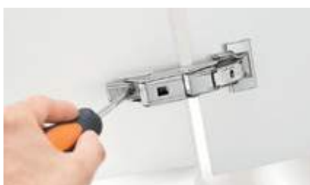
お馴染みの3方向調整機能

さらに詳しくは、 当社の扉用、フラップ用、および引出用の新しい 取付システム EXPANDO T の詳細についてはこ ちらをご覧ください。