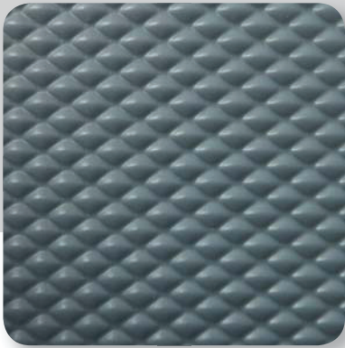
silber D silver D