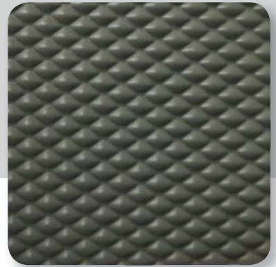
steingrau stone grey