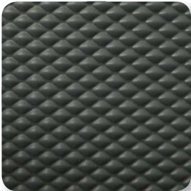
terrabraun terra brown